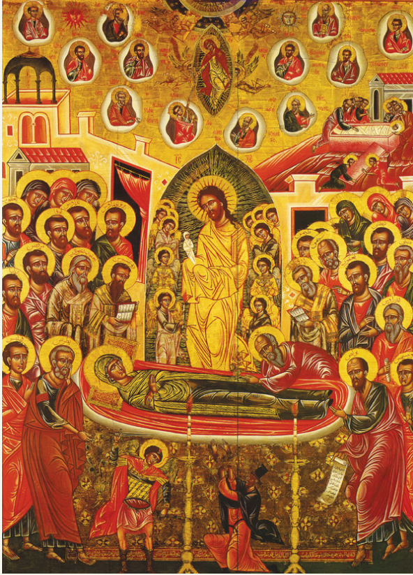
أيقونة رقاد والدة الإله، وهي من الأيقونات الحلبية المتواجدة في دير سيدة البلمند في لبنان.

عندما اقترب موعد انتقال العذراء من هذه الحياة، أخبرها الرب بقرّب يوم انتقالها. فطلبت من ابنها رؤية التلاميذ قبل انتقالها، لأنهم كانوا قد انتشروا للعمل البشري. فلبّى لها الرب هذا الطلب وأحضر التلاميذ جميعهم، على غمام، إلى مدينة الجسمانية، مكان رقاد العذراء، من أقاصي المسكونة باستثناء توما وذلك لقصد إلهي.