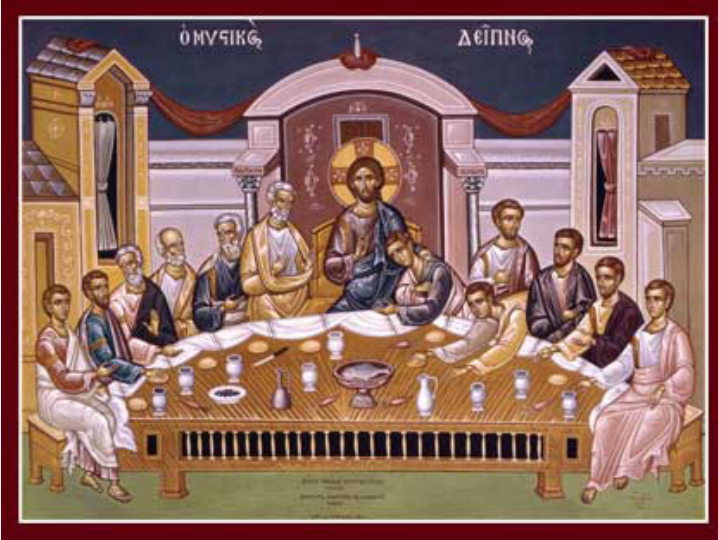
أيقونة العشاء السري

اقبليني اليوم شريكاً لعشاءك السري يا ابن الله، لأبي لست أقول سرّك لأعدائك، ولا أعطيك قبلة خاشعة مثل يهوذا، لكن كالصّحاح المحترق لك هاتفاً: اذكرني يا ربّ إذا أتيت في ملكوتك.