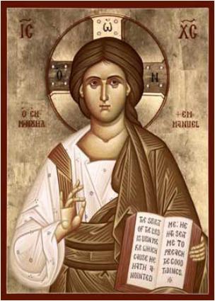
الرب يسوع المسيح

والفقراء والمساكين. عالمك يا حبيبي مضروب بالتحصيل، بالمال، يسابقتك على الركض للوقوع في بطن الحوت. في جحيم الموت.