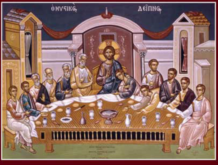
أيقونة العشاء السري

اقبلني اليوم شريكاً لعشاءك السري يا ابن الله، لأنني لست أقول سرّك لأعدائك، ولا أمطيك قبلة نائحة مثل يهوذا، لكن خالصاً أمتروك لك هاتفاً: اذكرني يا ربّ إذا أتيتَ هي ملكوتك.