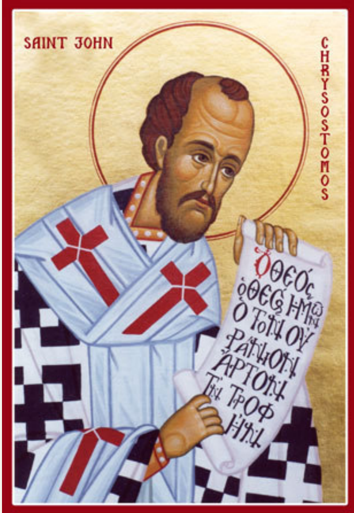
أيقونة القديس يوحنا الذهبي الفم